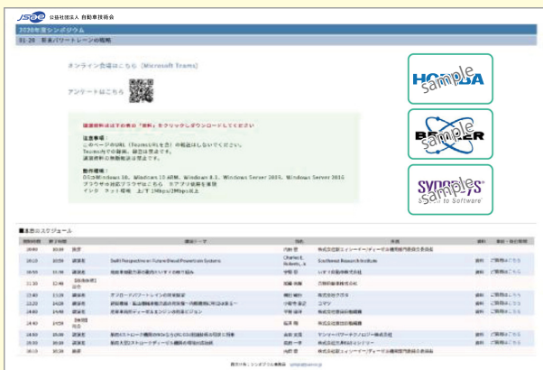
掲載例) 自動車技術会ホームページ内 シンポジウム詳細紹介ページ