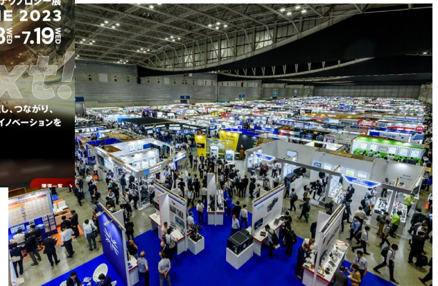
横浜・名古屋展示会場で 印刷版無料配布