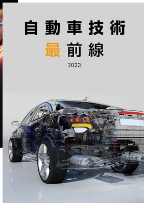
ダイジェスト印刷版