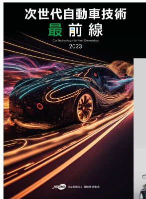
デジタルブック版

環境問題、エネルギー問題、人口の増加に伴う交通社会の安全対策・IT化による利便性の向上等、社会環境の変化に応じ自動車は様々な技術革新が求められています。“CASE”という言葉で代表される、百年に一度とも言われる自動車産業の大変革に対して、自動車技術はどのように進化し、新たな付加価値を創出していくのか。このような背景を踏まえ、自動運転、電動車、コネクティッド等の先進技術とその開発動向、また搭載される装置・部品・材料技術など幅広く特集する小冊子「次世代自動車最前線」を発行する運びとなりました。配布対象は自動車技術会会員及び人とするまのテクノロジー展の来訪者、発行形態はHTML5のデジタルブック+ダイジェスト印刷版の二種をご用意します。この機会に貴社製品技術をアピールしてみませんか。