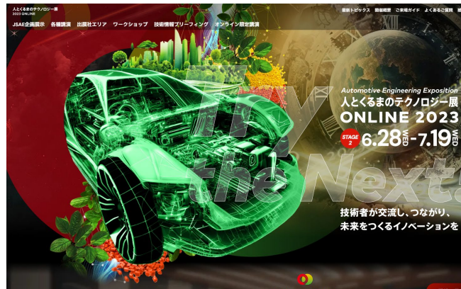
オンライン展示会サイトで デジタルブック無料配信